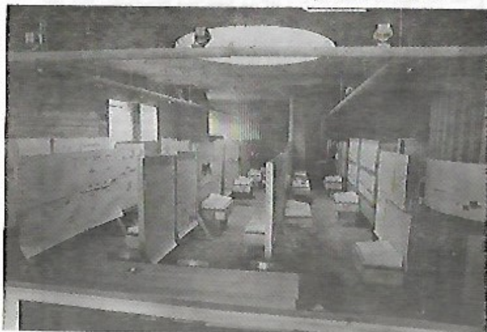
Vue générale de l'exposition

Nous vous tiendrons au courant de la suite des événements dans un prochain numéro.